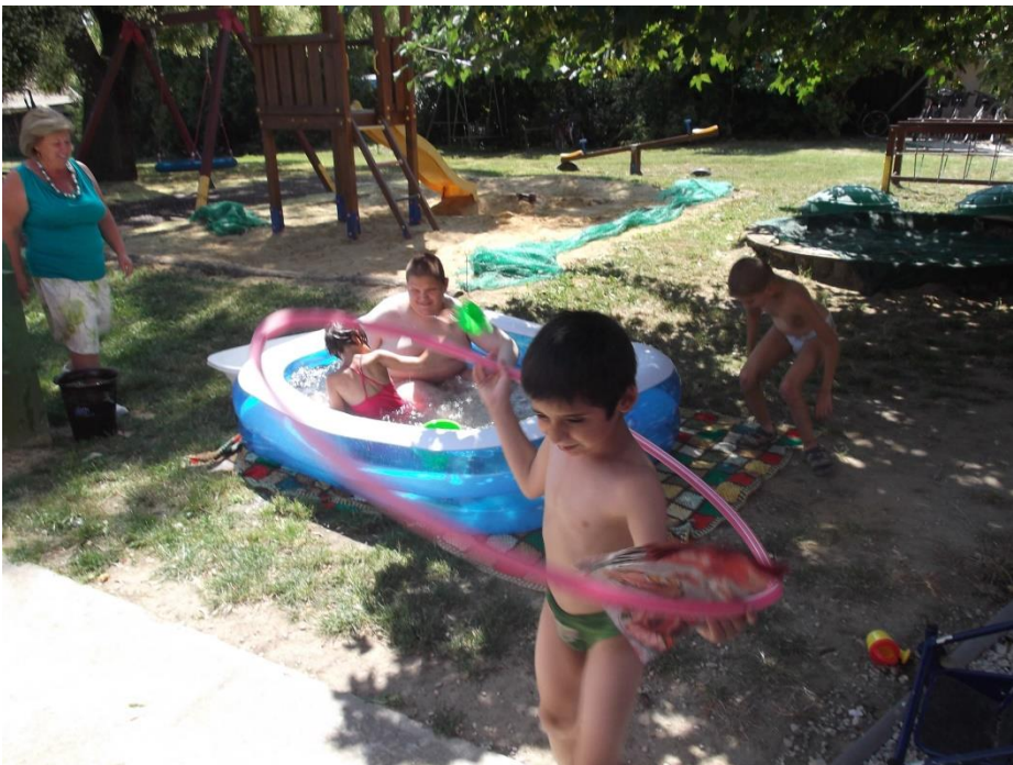
. Nyári hűsítő fürdő