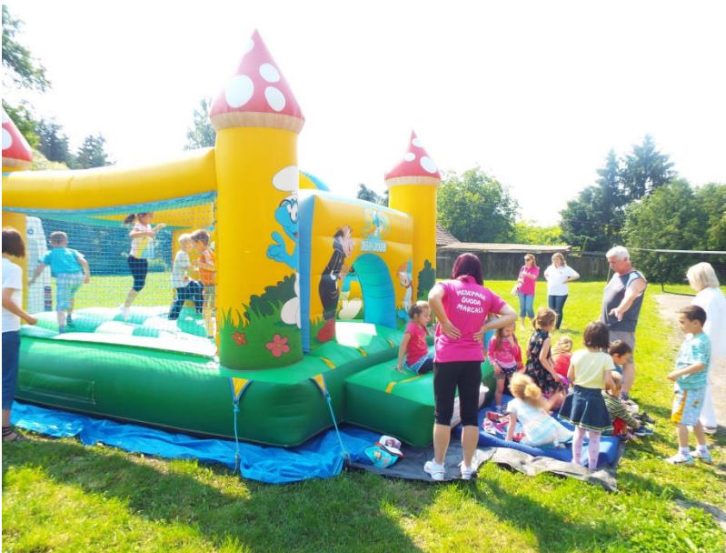
Gyereknapi programok Marcaliban az óvodásokkal