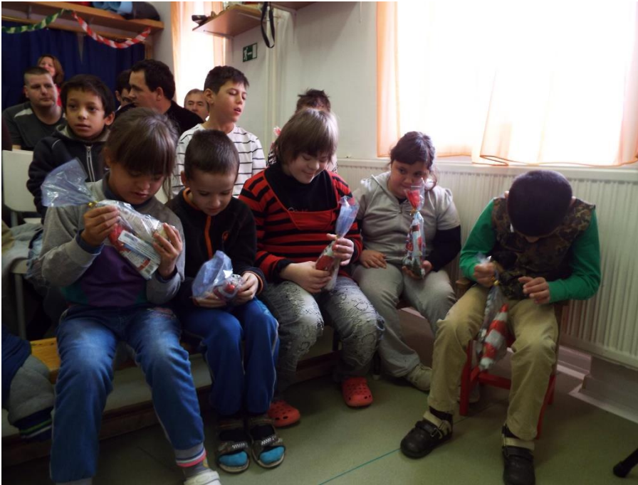
Mikulás ünnepség Marcaliban