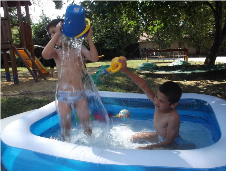
Nyári hűsítő fürdő