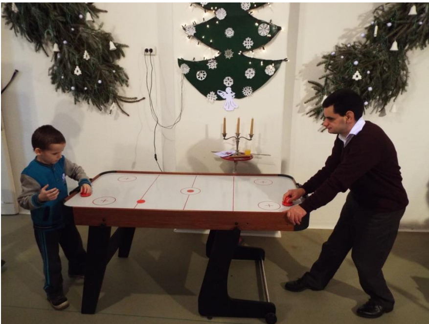
A képviselő úrtól kapott ajándékkal