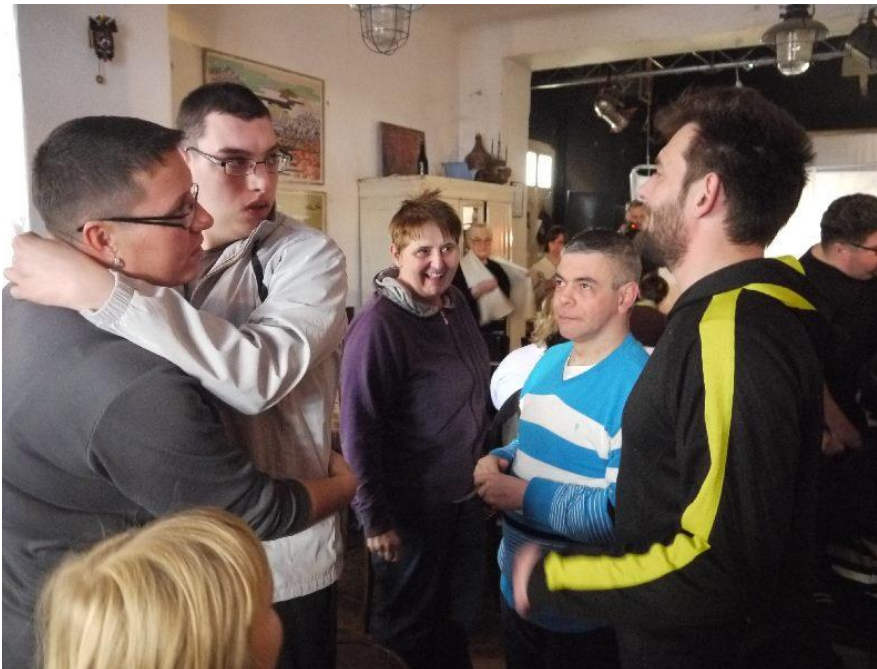
. Előadáson voltunk Pécssett