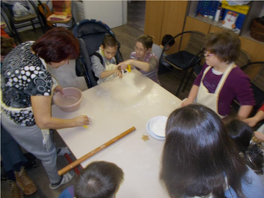
Sütemény sütés Siófokon